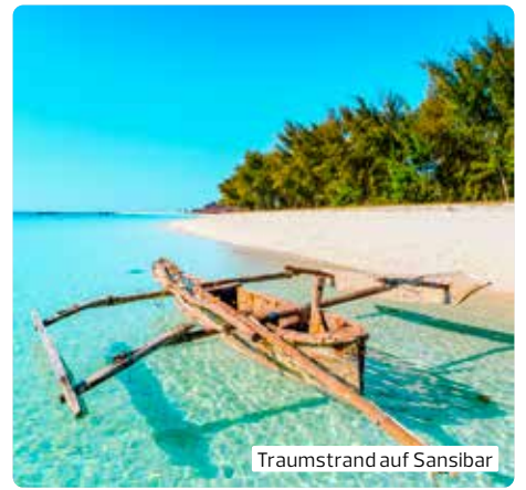
Traumstrand auf Sansibar