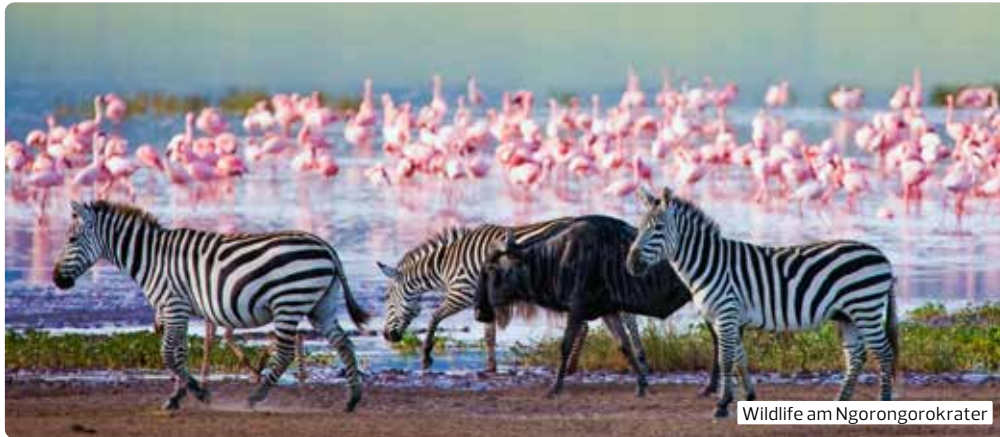
Wildlife am Ngorongorokrater