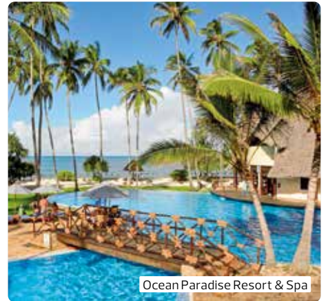
Ocean Paradise Resort & Spa

Sie das Serengeti-Dokumentationszentrum, wo Sie noch einmal auf Prof. Dr. Grzimek treffen. Nach dem Mittagessen im Camp begeben Sie sich auf eine weitere Pirsch im Herzen der Serengeti. (F, M, A)